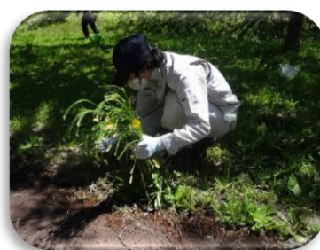
近隣公園での除草作業・落ち葉集め