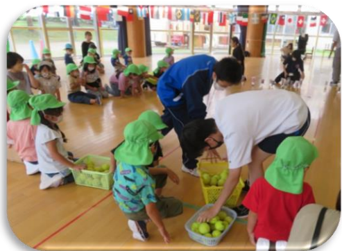
花輪さくら保育園交流